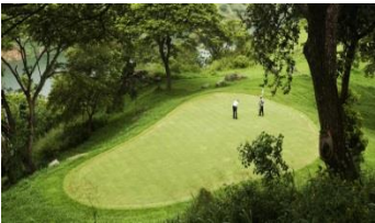
Victoria Golf Club ved Kandy.