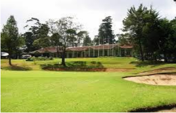
Nuwara Eliya Golf Club.