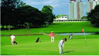
The Royal Colombo Golf Club.