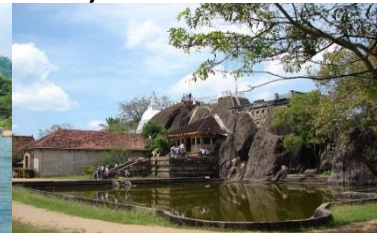
Isurumuniya Vihara Templet.

Vi kører til Giritallee og gør stop undervejs ved elefantbørnehjemmet i Pinnawela, som også er forskningscenter. Forladte elefantunger og syge voksne elefanter som findes i junglen samles her, hvor de opfostres og trænes til tempel eller arbejds- elefanter. De ser de små babyelefanter blive fodret med adskillige flasker mælk og følger elefantflokken når den skal til floden for det daglige bad.