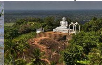
Tempelkomplekset i Mihintale.