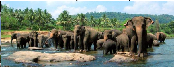
Pinnawela: Elefantbad i floden.