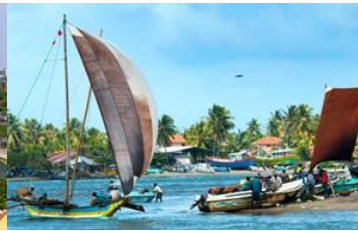
Katamaraner i Negombo.