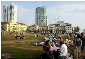
Galle Face Green.