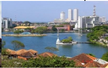
Beira Lake i Colombo.