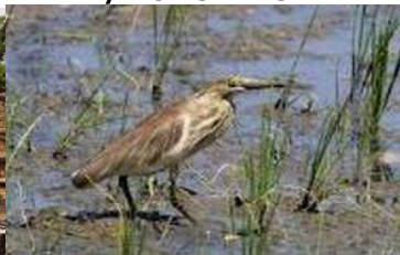
Pond/Grayii/Heron el. Paddybird skifter farve til hvid når den letter.