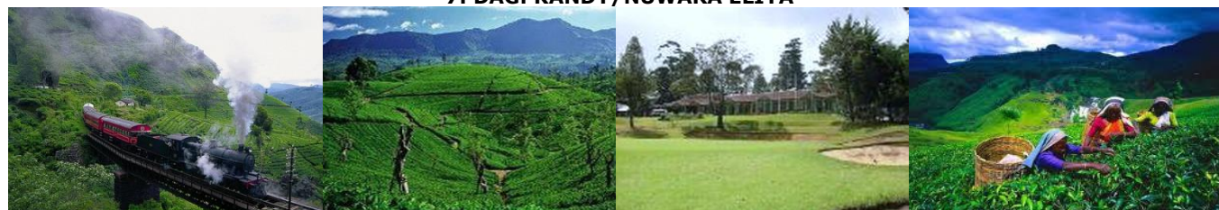
Bjergtoget til Nuwara Eliya.