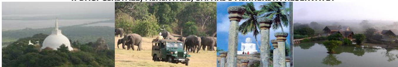
Dagoba i Mihintalee.